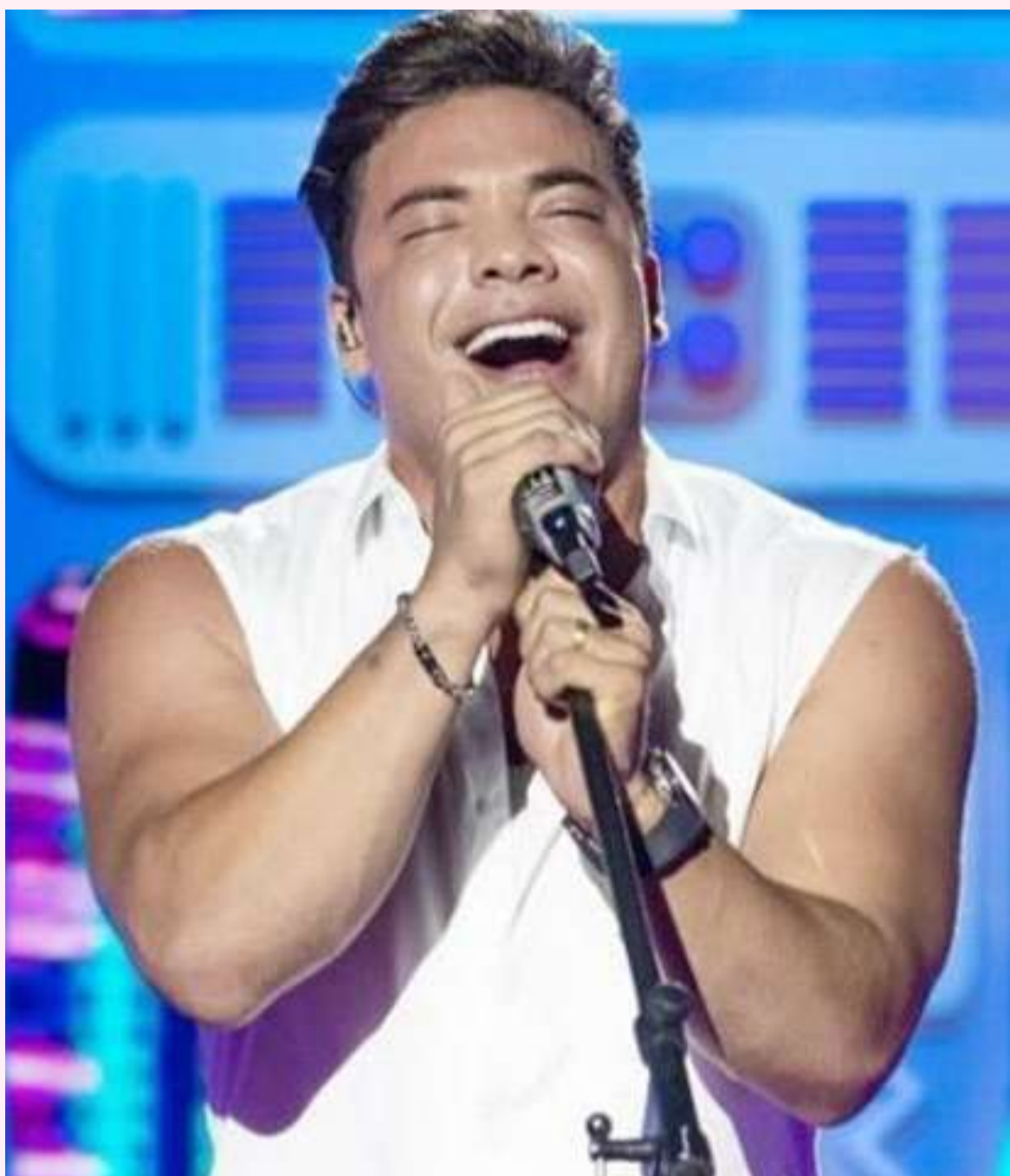
Wesley Safadão vai lançar novo show no Réveillon Vidam

locomoção com ônibus luxuosos ou traslados náuticos para as categorias Diamante, Ouro e Prata, como cortesia oferecida pelo Grupo VIDAM; decoração impecável de primeira com o