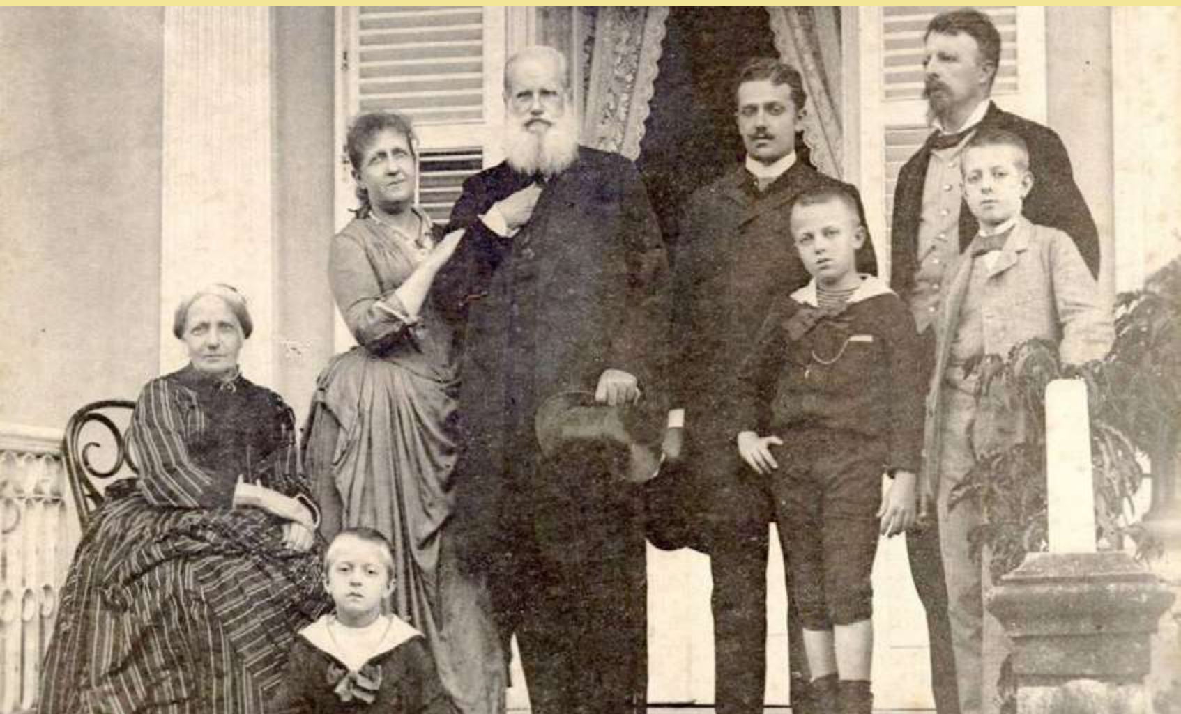
A família imperial brasileira em 1889, por Otto Hees Restoration

tem-se o recorte proposto pelo cientista social carioca Sérgio Abranches, para quem estamos vivendo a nossa Terceira República, iniciada em 1988. Sendo assim, teríamos a Primeira República sendo aquela vivida entre a Proclamação e o Governo Vargas, de 1889 a 1930, e a Segunda República, aquela vivida na ascensão da Guerra Fria, entre 1945 e 1964.