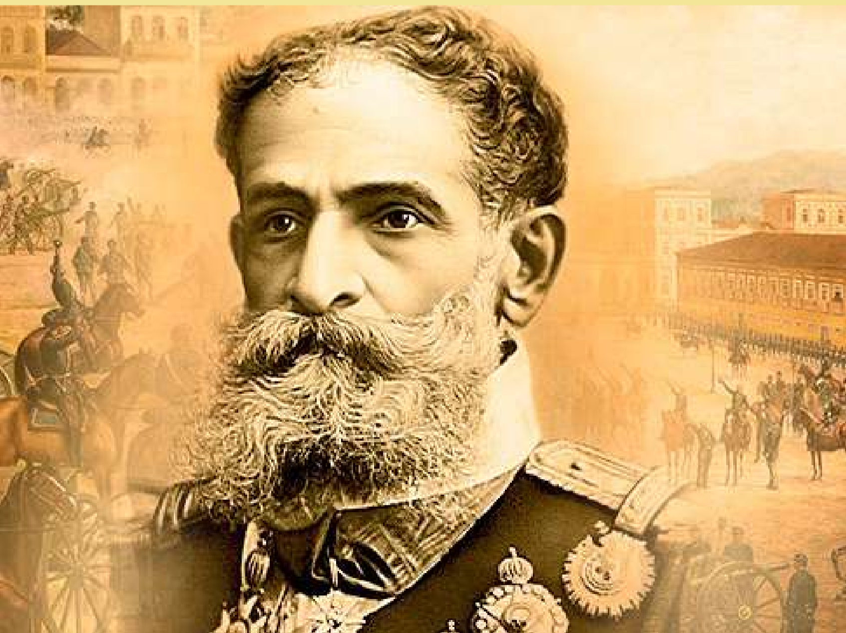
Deodoro da Fonseca

Apesar de bem conhecidos, os eventos do 15 de novembro merecem ser revisados. Liderados pelo professor de Engenharia da Escola Militar da Praia Vermelha, Benjamin Constant, um grupo de militares de baixa patente recorre ao Marechal Deodoro da Fonseca pedindo apoio para tirar o imperador do poder.